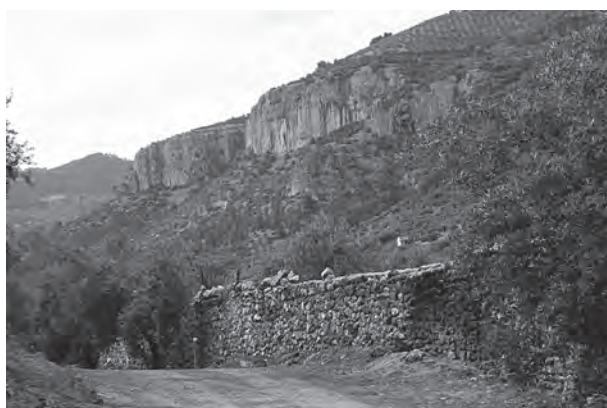
Las palomas desde el molino de Saro

vuelos rápida y vorazmente por la vegetación.