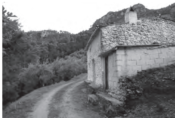
Tapuela del mulero de Saro

colladete que nos permite divisar, al otro lado, el cortijo de la capaora, ahora llamado para el turismo, cortijo de los Lomas. Descendemos todo lo que subimos para situarnos al nivel del río, enfrente de la