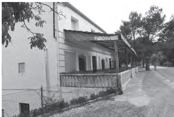
Venta del Pino

Andaremos atentos, ya que a la izquierda encontraremos un vado, siempre antes de llegar al cortijo del Chillar, lo cruzaremos y continuaremos por un carril que en fuerte ascenso nos lleva hasta un