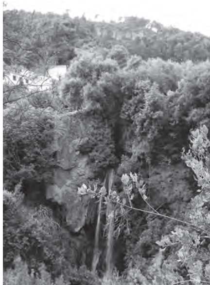
Chorreón de Natao

En el tramo que recorreremos hay cuatro puentes y un vado natural que sirvieron para que el trasiego de la sierra fuera fluido. De los cuatro, sólo dos permiten el tráfico de vehículos, el puente Ortega y puente de los Agustines, el primero da acceso mediante carriles olivares al valle de Chincoya y al barranco del Lobo, el segundo a la sierra profunda mediante la carretera transversal. Los otros