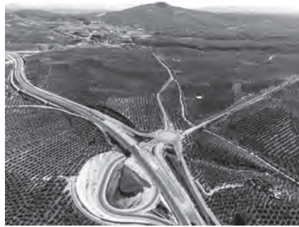
Nueva A32; a la derecha, rotonda de enlace con la nueva carretera a Sorihuela

El tramo puesto en servicio en septiembre supone conectar Úbeda con Villacarrillo quedando la actual carretera N-322 como vía de servicio de la autovía, por lo que se modifica su trazado manteniendo la continuidad, resultando la vía de comunicación principal para el acceso a las propiedades colindantes. La autovía