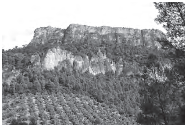
Piedra de la B

Construyeron puentes elevados con pilares, rematados con largueros de grandes pinos que por entonces tanto abundaban, talados por ellos mismos tras el preceptivo permiso y concesión por el correspondiente Ingeniero de Montes. En ocasiones, había que proceder a cambiarlos porque se pudrían, a veces, la construcción no soportaba el envite de la riada y había que reconstruirlos, otras no merecía la pena, porque el lugar elegido no era el idóneo y allí quedaban sus restos, en-