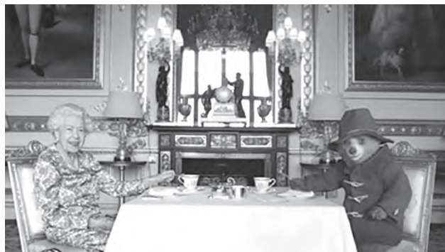
No, no es ninguno de sus nietos. Isabel II está tomando el té con el icónico osito Paddington, imagen que captura uno de los momentos del vídeo que se realizó para celebrar su 70 aniversario en el trono.

Así pues, asistimos a un fenómeno nada novedoso y que, de hecho, siempre ha existido: el de los clubs de fanes. Estos podrían definirse por el sentimiento de unidad