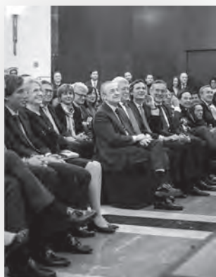
Algunos de los asistentes, con Florentino Pérez o Enrique Cerezo en primera fila

la emoción de todas esas pequeñas grandes historias que conforman nuestra Historia con mayúsculas.