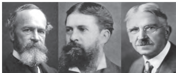
James, Peirce y Dewey, representantes clásicos del pragmatismo norteamericano

El pragmatismo (la corriente de pensamiento genuinamente norteamericana habida cuenta de que representa la idiosincrasia del pueblo de los Estados Unidos hecha filosofía) me parece, desde un punto de vista epistemológico, errado, ya que una teoría en un campo donde goza de bastante predicamento —la ciencia— no es verdadera porque resulte útil, sino justamente al revés, resulta útil porque es verdadera, o sea, aquella nos permite operar eficazmente sobre la realidad en la medida que consigue aprehender, de algún modo, la naturaleza de esta última. Como ha aseverado el psicólogo, profesor y ensayista cubano Gonzalo Torroella (1918/2006) ratificando la anterior posición: "Todas las